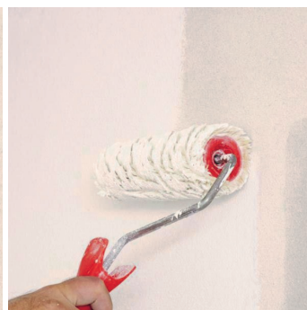
Obr.4 Provedení nátěru barvou.