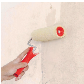
Obr.3 Provedení penetračního nátěru.