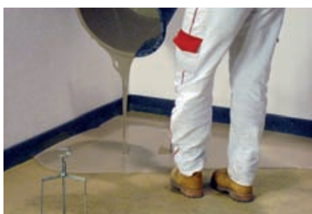
Vylití směsi v předepsané konzistenci