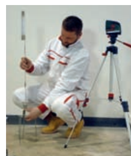
Nastavení a rozměření výšek