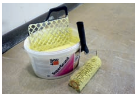
Nanesení systémového kontaktního můstku