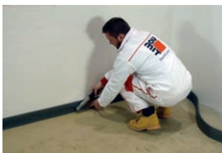
Dodržení zásad dilatací

předpisu Baumit pro potěry a samonivelizační stěrky, při jejichž dodržení Baumit Nivello Quattro vykazuje velmi dobré zpracovatelské vlastnosti a je docíleno atraktivních výsledných povrchů.