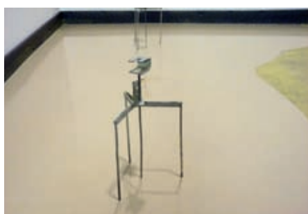
Rozprostření, vylití směsi v ploše