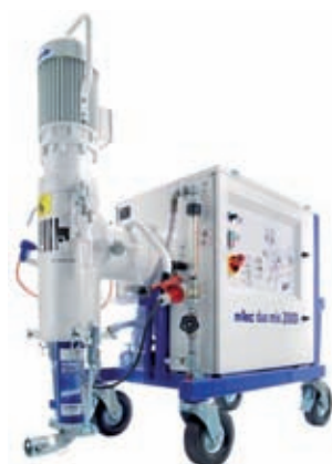
Duomix 2000 – strojní zařízení pro zpracování sádrové stěrky Baumit Nivello Quattro