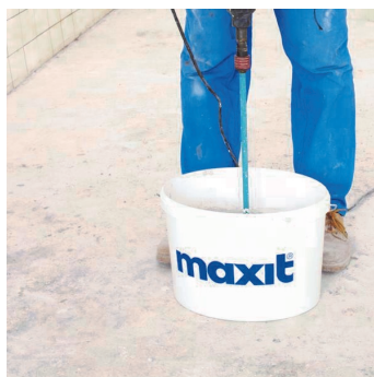
Obr.3 Promíchání penetračního nátěru.