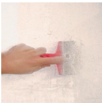
Obr.2 Odstranění nesoudržných vrstev.