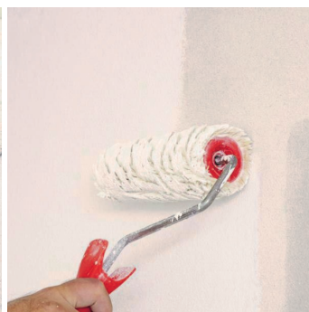
Obr.4 Provedení penetračního nátěru v 1 nebo více vrstvách.