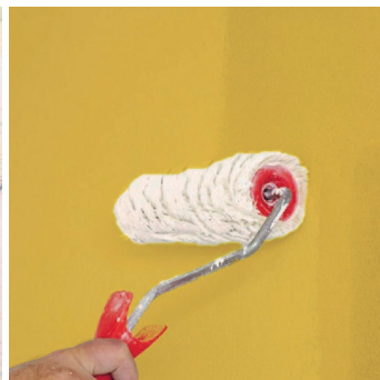
Obr.4 Provedení penetračního nátěru v 1 nebo více vrstvách.