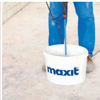
Obr.3 Promíchání penetračního nátěru.