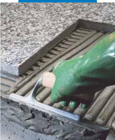
Lepení vymývané betonové dlažby v exteriéru