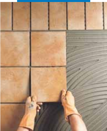
Lepení klinkeru v exteriéru