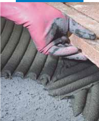
Lepení ručně vyráběné dlažby typu cotta na nevyrovnaný cementový potěr