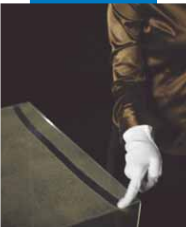
Při použití tradičního cementového výrobku