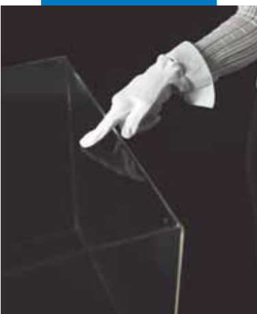
Při použití výrobku s technologií Low Dust

prostředí nejméně 30 minut; při nepříznivých podmínkách prostředí (sálající slunce, vysušující větry, zvýšené teploty) nebo lepení na silně nasáklé podklady může dojít k výraznému zkrácení doby zavadnutí, a to až na několik málo minut.