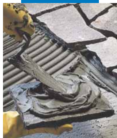
Lepení dlažby z lámaného přírodního kamene bez anebo s "podmazáním" v závislosti na tloušťce