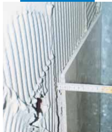
Lepení slinutého obkladu stěn do silné vrstvy lepidla