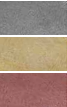
BROŽ Standard šedá