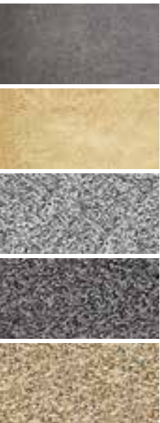
BROŽ Standard Bazalt (melír šedo-černý)