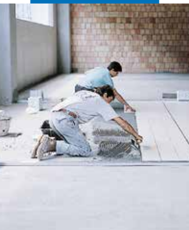
Pokládka dlažby typu gres v průmyslovém prostředí

Všechno nářadí je možné umýt vodou, dokud je výrobek ještě čerstvý. Po vytvrzení je čištění složité a lze ho provádět s použitím rozpouštědel, terpentýnem nebo podobnými prostředky.