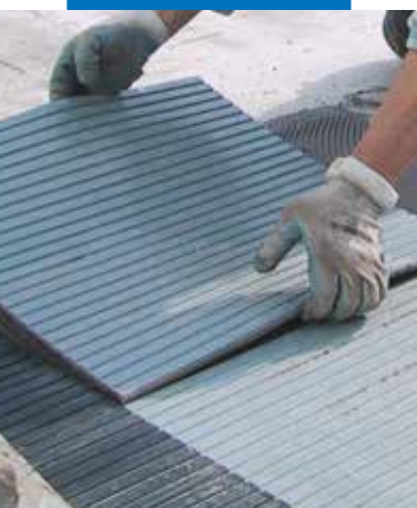
Lepení gumové dlažby s použitím Granirapidu na betonový podklad