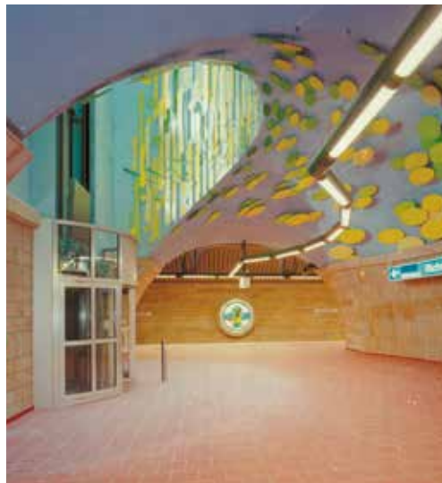
Ukázky instalace žuly s použitím Granirapidu v metru v Mülheim Ruhr (Německo)