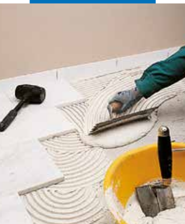
Pokládka bílého mramoru Carrara s použitím bílého Granirapidu