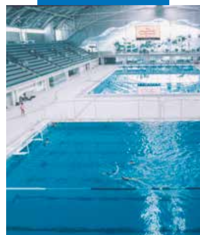
Ukázka instalace mozaiky a klinkeru v bazénu - Olympijské centrum, Sydney (Austrálie)