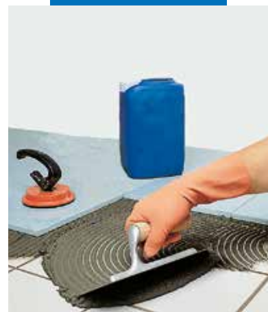
Pokládka konglomerátové dlažby na stávající dlažbu z keramiky s použitím šedého Granirapidu

Deformační schopnost podle EN 12004: S1 - deformovatelný