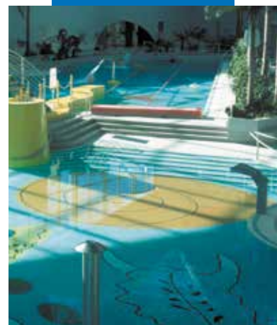
Ukázka instalace mozaiky a klinkeru v bazénu