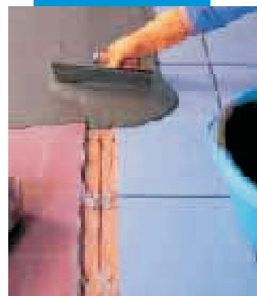
Vyrovňování povrchu staré podlahy pomocí Adesilexu P4