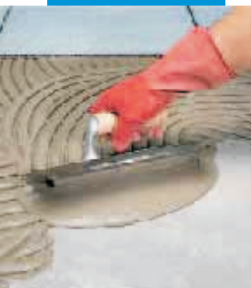
Nanášení pomocí stěrky s polokruhovými zuby