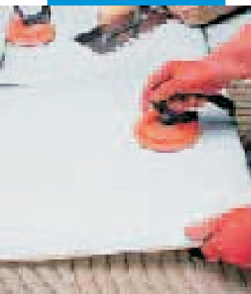
Lepení dlaždic velkého formátu