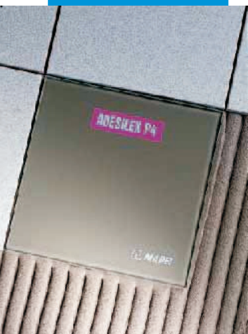
Porovnání efektu smočení rubové strany mezi běžným lepidlem a Adesilexem P4

hrudek. Směs nechejte 3 minuty odstát a znovu ji krátce promíchejte. Takto připravená směs je zpracovatelná cca 60 minut (při teplotě +23°C a 50% relativní vlhkosti vzduchu).