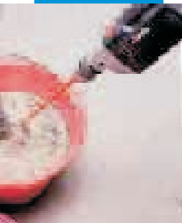
Směs Adesilex P4

V čisté nádobě smíchejte 25 kg Adesilexu P4 (1 pytel) s 5 až 5,5 litry vody. Míchejte tak dlouho, až vznikne dokonale hladká směs bez