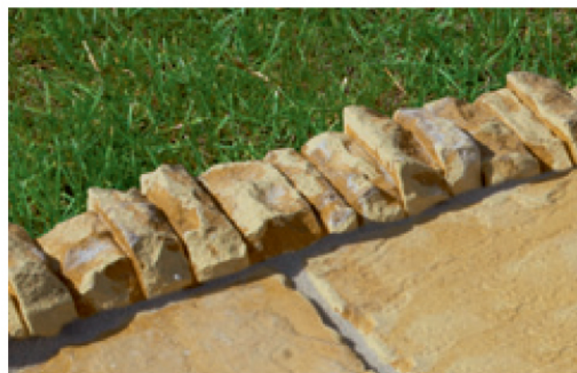
Ⓔ Obrubník kamenný lámaný Ⓔ, Melír pískovec