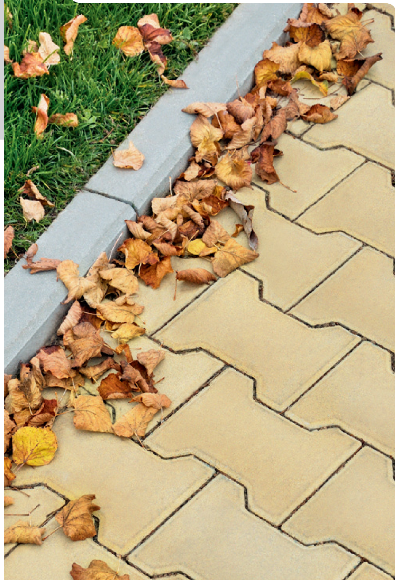
Ⓔ Obrubník chodníkový Ⓔ, Standard přírodní