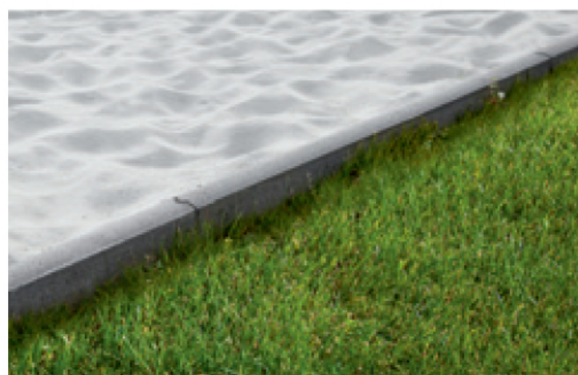
Ⓔ Obrubník záhonový kulatý se zámkem Ⓔ, Standard přírodní