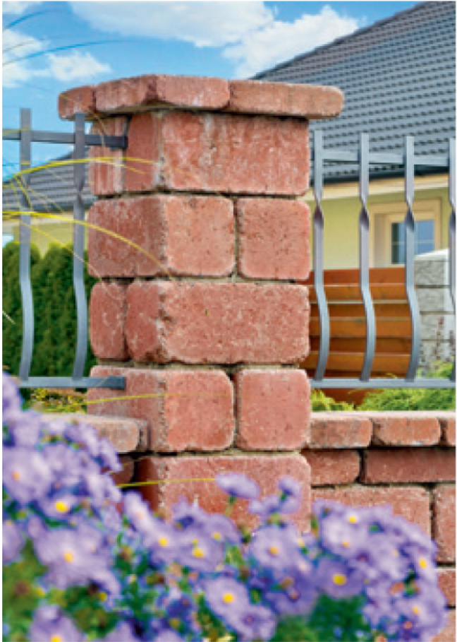
⑥ Otloukaná plotová tvárnice, červená