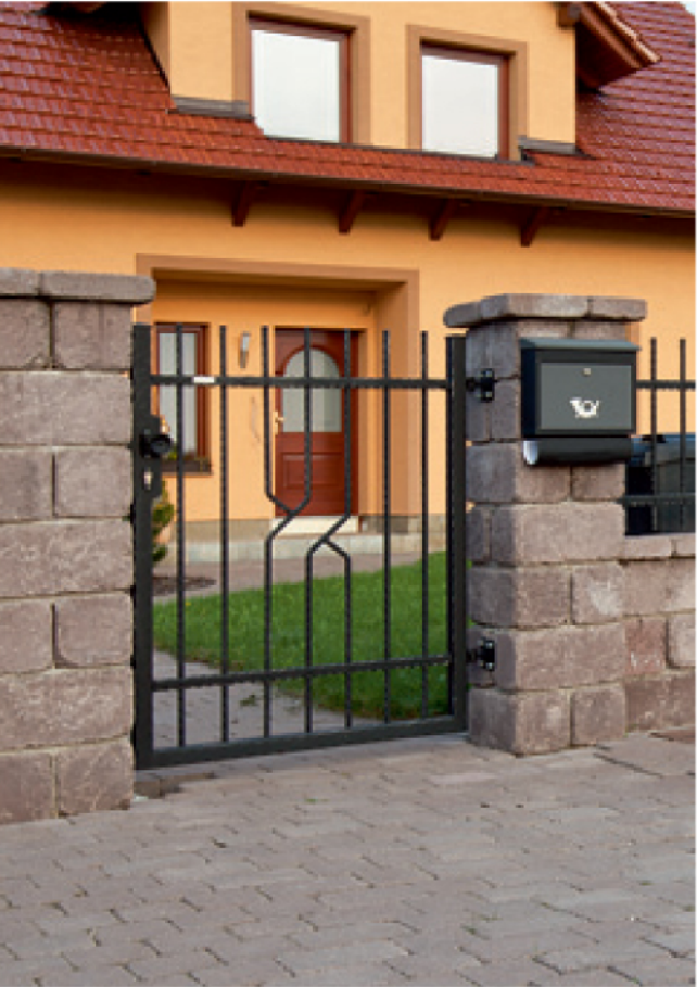
⑦ Otloukaná plotová tvárnice, hnědá