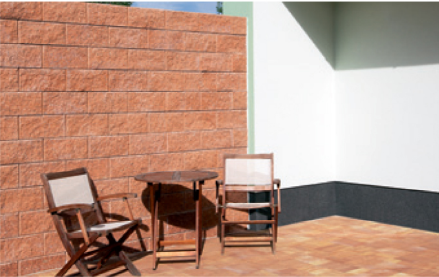
Štípaná jednostranná A, cihlová