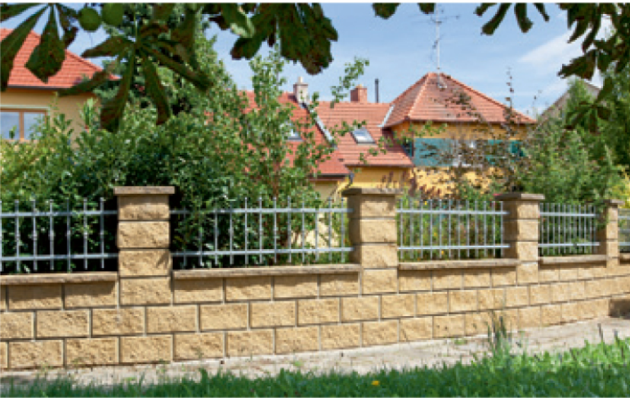
Štípaná oboustranná B, E, písková; stříška štípaná, písková