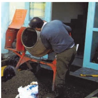
Obr.1b Namíchání bubnovou míchačkou.