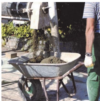
Obr.1a Namíchání kontinuální míchačkou.