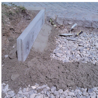
Obr.2 Usazení stavebního prvku do čerstvého betonu.