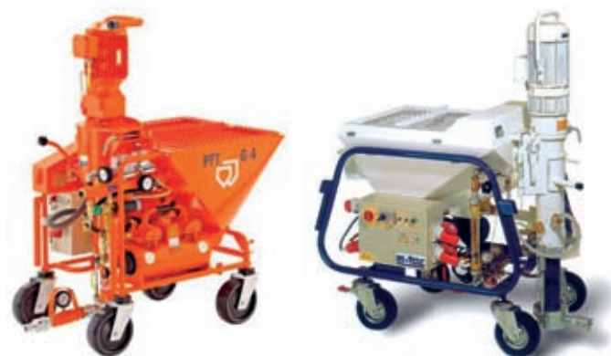
Omítací stroje PFT G4, G5, m-Tec m3E strojní zařízení pro zpracování strojních sádrových omítek Baumit