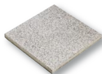
40,5 x 40,5 x 3,8